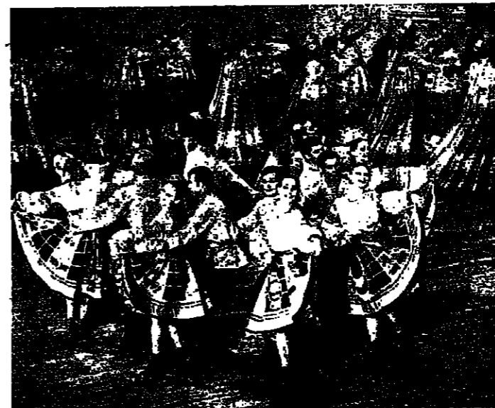
رقصات دائرية ، اغاني زغانا في تشيكلة رانصة

اسمها بلاد الاغاني . سكنها من الموسيقيين ، اكتشفوا المعالم الجمال المقوم ، والغريب انهم ولدوا في هذه الارض التي تدعى جورجيا في الشطر الاوروبي للاتحاد السوفياتي ... ومازالوا يحيون التقاليد الموسيقية القديمة ويطورونها . ولجل ذلك ، توجد عشرات الفرق الغنائية في مدن المنطقة وقراها . في الصورتين تبدو جوقية بلاد الاغاني الشعبية ، وقد انشئت منذ ٣٠ عاماً ، تقدم برامج قديمة وحديثة : رقصات دائرية ، اغاني زغانا ، واغان عاطفية ، في تشكيلة من الآلات الموسيقية : البايلاكا ، الابواق ، الجانجكلا ، القيثارات والاكورديون . ( خاص من «توتوسفي» )